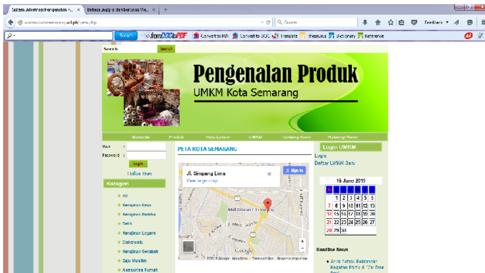
Gambar : Peta Lokasi

Gambar Menu Produk berisikan produk-produk unggulan yang ada di UMKM Kota Semarang. Produk dapat di lihat secara detail dari mulai identifikasi produk, UMKM yang memproduksinya, alamat UMKM dan harga produk unggulan tersebut.