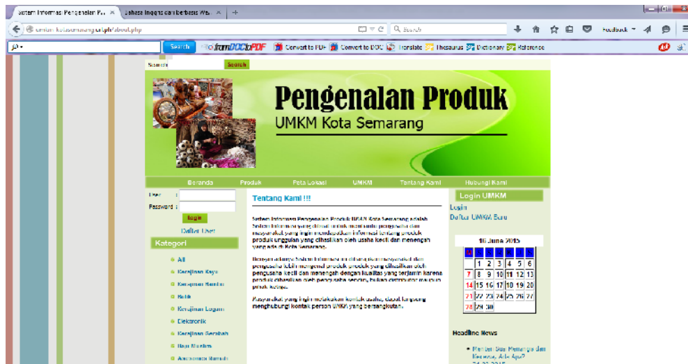
Gambar : Tentang Kami

Menu Tentang Kami menampilkan Informasi mengenai pembuatan Sistem Informasi Produk-produk Unggulan UMKM Kota Semarang.