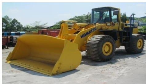
Gambar 9. Loader

Alat ini memiliki fungsi yang sama dengan Dozer . PBM lebih sering menggunakan Loader sebagai pengumpul muatan di dalam palka, karena loader lebih cepat untuk bermanuver di dalam palka. Begitu juga saat digudang, pada saat digudang selain sebagai pengumpul muatan Loader juga digunakan sebagai alat untuk mengambil muatan dan selanjutnya ditumpahkan ke atas truk untuk diangkut ke gudang penerima.