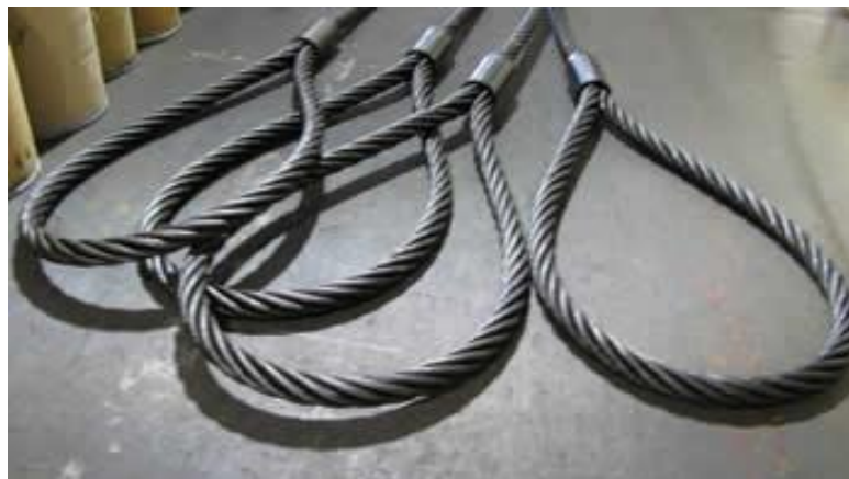
Gambar 11. Tali Sling

Merupakan perlatan yang digunakan untuk mengikat antara grabe dengan sling Harbour Mobile Crane HMC/Crane kapal, selain itu juga digunakan untuk mengikat pada saat menaikan alat berat untuk memperlancar kegiatan bongkar muat.