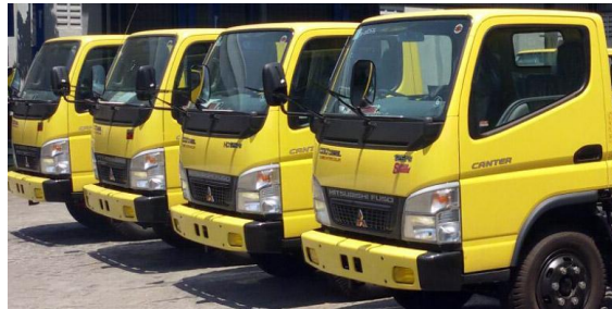
Gambar 10. Truk

Dalam pembongkaran barang curah kering, truk merupakan alat penunjang yang sangat penting, karena ketersediaan truk sangat berpengaruh untuk cepat atau lambatnya pembongkaran.