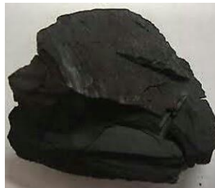
Gambar 4. Batu Bara Lignit