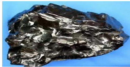
Gambar 1. Batu Bara Antrasit