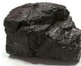
Gambar 2. Batu Bara Bituminous