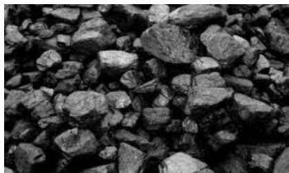
Gambar 5. Batu Bara Gambut