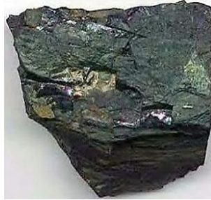
Gambar 3. Batu Bara Sub-Bituminous