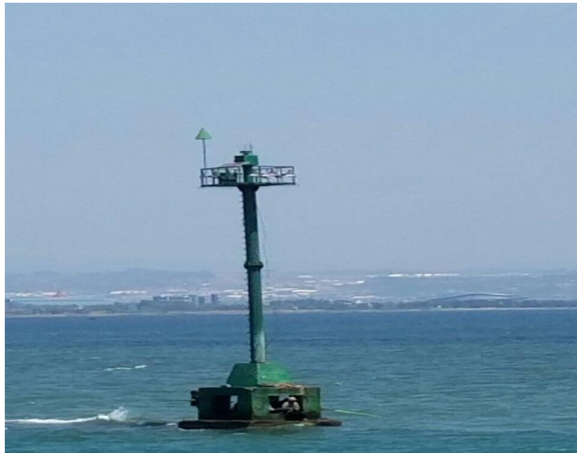
Gambar 2.3 Resilient Light Beacon (RLB)

serta menentukan posisi dan haluan kapal. Suar yang dibangun pada umumnya di pantai sehingga sebagian bangunannya berada di bawah permukaan air (terendam air). Bangunan fisik sebuah rambu terbuat dari rangka baja dengan cat warna merah-putih atau warna mencolok lainnya. Rambu berpenerangan baik untuk patokan penentuan posisi kapal karena posisinya tetap dan kemungkinan bergeser sangat kecil (fix)