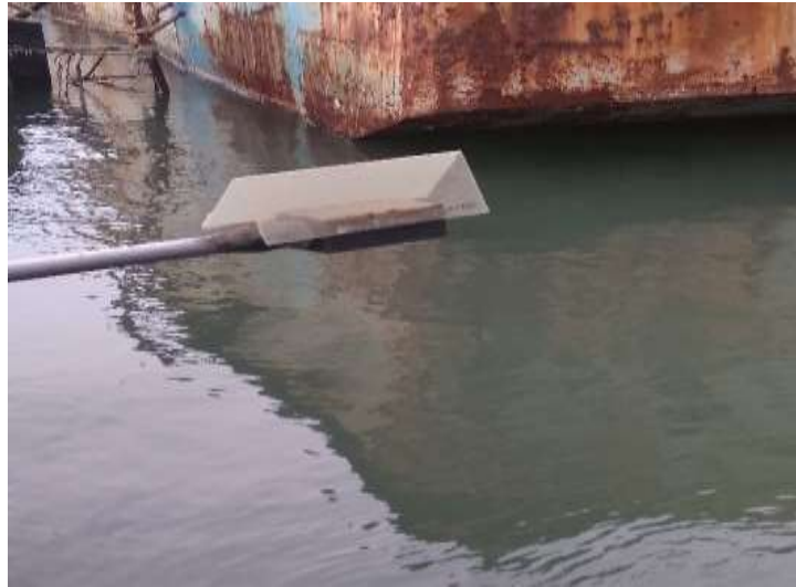
Gambar 5. Floating tide gauge BMKG Stamar