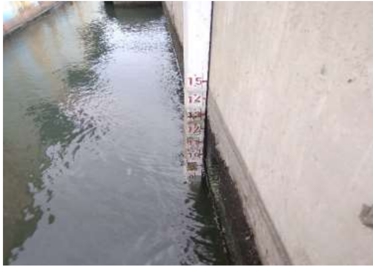
Gambar 4. Papan pasang surut BMKG Stamar