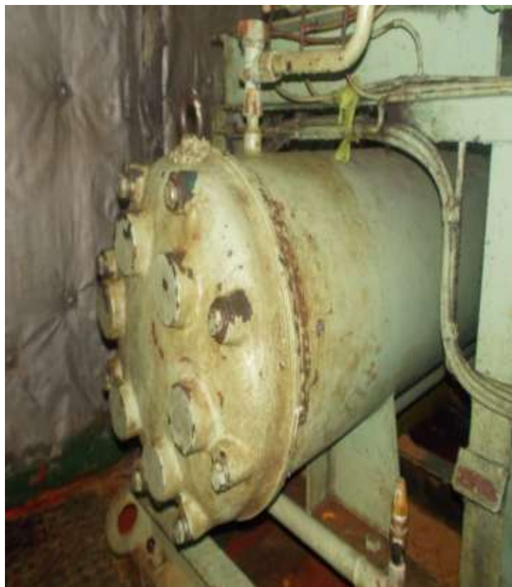
Gambar 3. Kondensor

Kondensor adalah sebuah alat yang digunakan untuk mengubah/mendinginkan gas yang bertekanan tinggi dan bersuhu tinggi dari discharge kompresor menjadi cairan refrigeran yang masih bersuhu dan bertekanan tinggi dengan media air laut. Berikut contoh gambar kondensor :