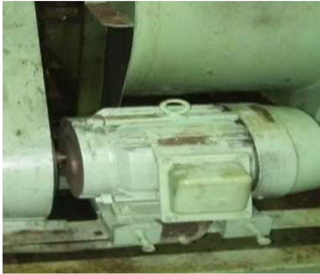
Gambar 8. Motor Listrik