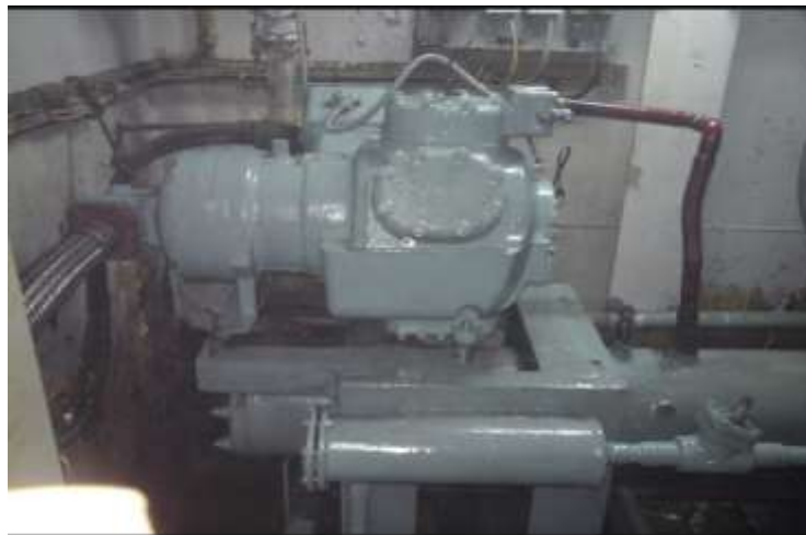
Gambar 2. Kompresor

Kompresor adalah suatu alat mekanis dan bertugas untuk menghisap uap refrigerant dari evaporator. Kemudian menekannya dengan demikian suhu dan tekanan uap tersebut menjadi lebih tinggi. Tugas kompresor adalah mempertahankan perbedaan tekanan dalam sistem. Kompresor atau pompa hisap-tekan berfungsi mengalirkan refrigerant ke seluruh sistem pendingin. Sistem kerjanya adalah dengan mengubah tekanan sehingga berpindah dari sisi bertekanan tinggi ke sisi bertekanan lebih rendah. Semakin tinggi temperatur yang dipompakan semakin besar tenaga yang dikeluarkan oleh kompresor. Kompresor merupakan jantung dari sistem kompresi. Pada saat yang sama kompresor menghisap uap refrigerant yang bertekanan rendah dari evaporator dan mengkompresinya menjadi uap bertekanan tinggi sehingga uap akan tersirkulasi.