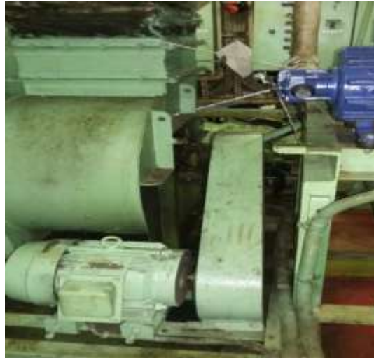
Gambar 7. Blower Beserta Motor Listrik

yang dihembuskan oleh blower ini akan melewati evaporator. Apabila AC dalam keadaan normal, maka udara yang melewati ini panasnya akan diserap oleh Freon sehingga suhunya akan dingin dan keluar menuju ruang komondasi.