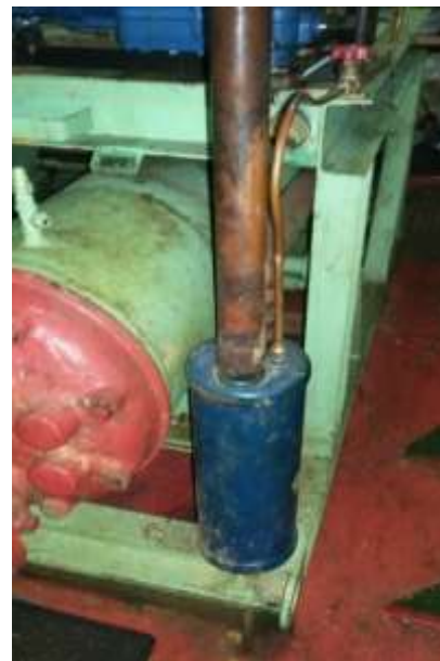
Gambar 6. Oil Separator