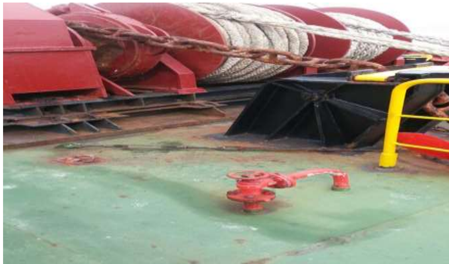
Gambar 3. Mesin Windlass Berporos Horizontal

Di kapal MV.JK GALAXY PT. AMAS SAMUDRA JAYA