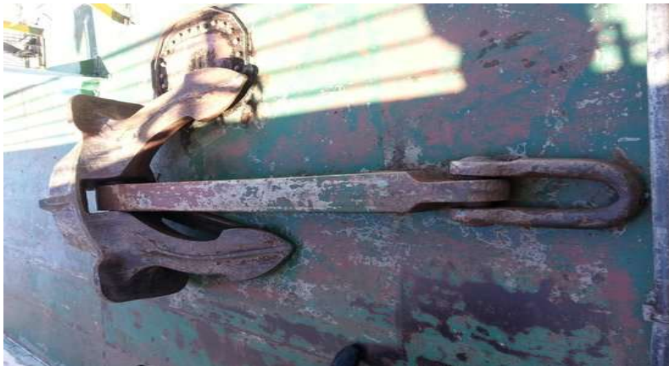
Gambar 5. Jangkar Kapal anchor

Jangkar adalah perangkat penambat kapal ke dasar perairan, di laut, sungai ataupun danau sehingga kapal tidak dapat berpindah tempat karena hembusan angin, arus atau gelombang. Jangkar merupakan salah satu alat wajib yang ada di atas kapal mengingat fungsinya sebagai alat untuk menahan kapal supaya tidak bergerak dan tetap dalam posisinya. Pada umumnya gerakan kapal di akibatkan oleh adanya.