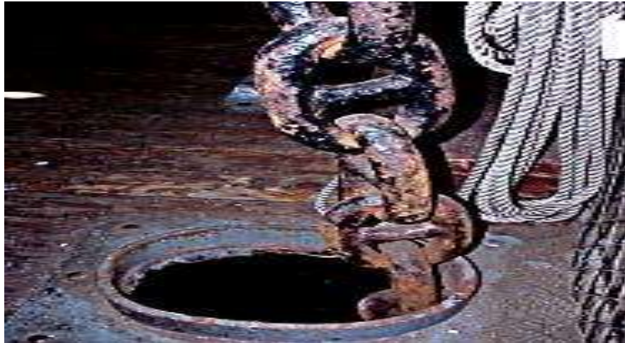
Gambar 9. tabung rantai jangkar Anchor Chain Pipe