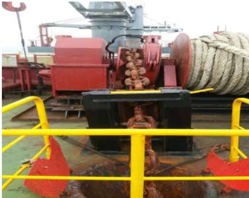
Gambar 10. Mesin windlass di Kapal MV. JK GALAXY PT. AMAS SAMUDRA JAYA

Mesin windlass adalah merupakan mesin derek jangkar yang dipasang dikapal guna keperluan mengangkat dan mengulur jangkar dan rantai jangkar melalui tabung jangkar dan Sebagai unit penggerak saat menarik dan mengulur jangkar dan rantai jangkar. Sumber : masilh4m. Wordpress. Com / 2010 / 04 /08 / jangkar /teori mesin jangkar