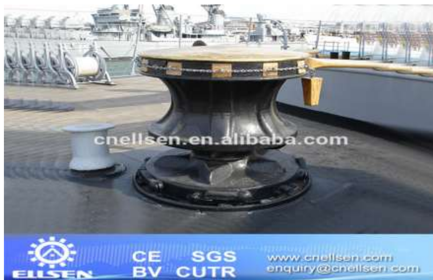
Gambar 4. Windlass berporos vertikal

Prinsip kerja mesin windlass ini pada dasarnya sama dengan windlass berporos horizontal dan alat pengunci wild cat menggunakan tenaga manual. Mesin banyak digunakan pada kapal perang karena mesin mudah dipelihara, kontrol rantai saat diturunkan mudah.