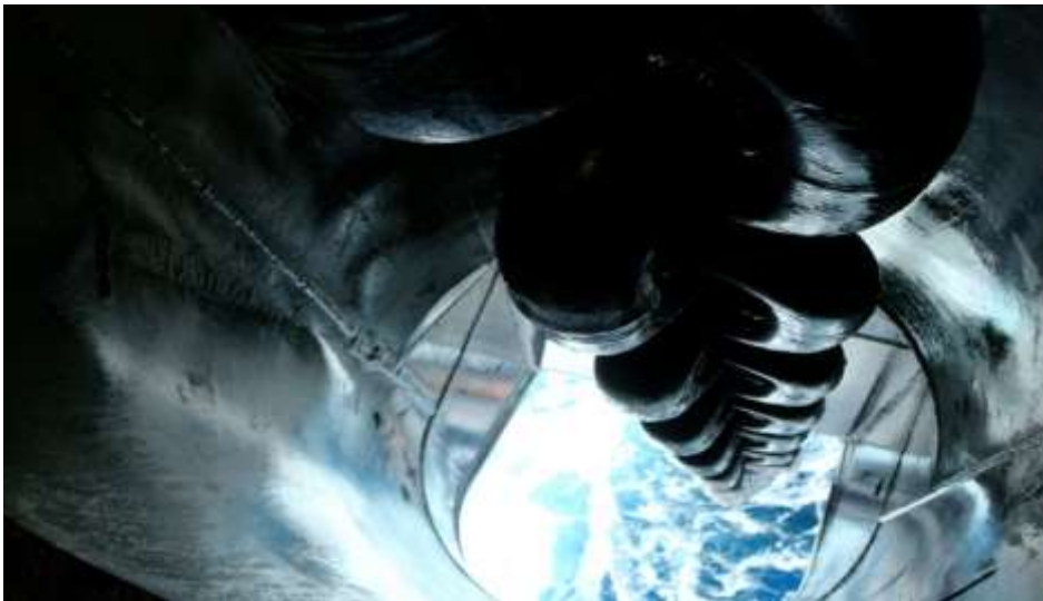
Gambar 7. Tabung Jangkar Hawse Pipe

Tabung jangkar hawse pipe merupakan tabung yang dilalui oleh rantai jangkar. Pada umumnya, tabung jangkar terletak dilambung kapal dibagian kiri dan kanan hingga geladak depan haluan kapal agar mempermudahnya mengatur posisi saat penurunan jangkar dan sebagai titik poros penurunan jangkar agar mudah di atur agar kapal tidak larat.