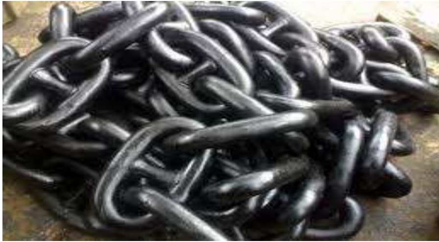
Gambar 6. Rantai Jangkar