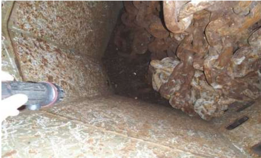
Gambar 8. Bak Rantai Jangkar anchor chain locker di Kapal MV. JK GALAXY PT. AMAS SAMUDRA JAYA

Bak rantai adalah tempat penyimpan rantai jangkar, penempatan yang terbaik sesuai dengan posisi mesin windlass . Bak rantai terletak dibagian depan kapal di depan sekat tubrukan dan diatas tangki haluan fore peak tank . Jika jumlah jangkar kapal terdapat dua set maka bak rantai harus terdiri dari dua ruang bak rantai yang terpisah yang sekat pembatas kiri dan kanan. Dalam pembuatan bak rantai, ada beberapa hal yang harus diperhatikan dan tentunya sesuai dengan ketentuan dan persyaratan badan klasifikasi.