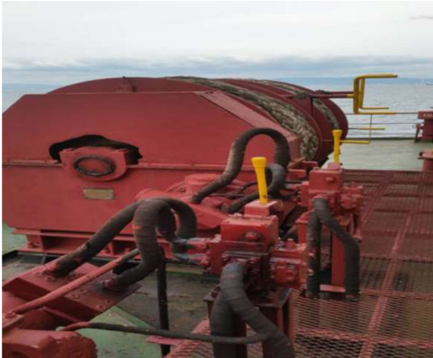
Gambar 2. Mesin windlass penggerak electro hydraulic Di kapal MV. JK GALAXY PT. AMAS SAMUDRA JAYA

pompa torak hydraulic , motor hydraulic, poros dan roda gigi, kepala penggulung tali tambat, wild cat , pompa pengeluaran minyak hydraulic , roda tangan dan katup relief . Dimana saat pengoprasiannya lebih mudah dan perawatannya lebih sederhana dan di kapal MV. JK GALAXY taruna praktek menggunakan windlass dengan penggerak electro hydraulic yang mana sistemnya seperti diatas.