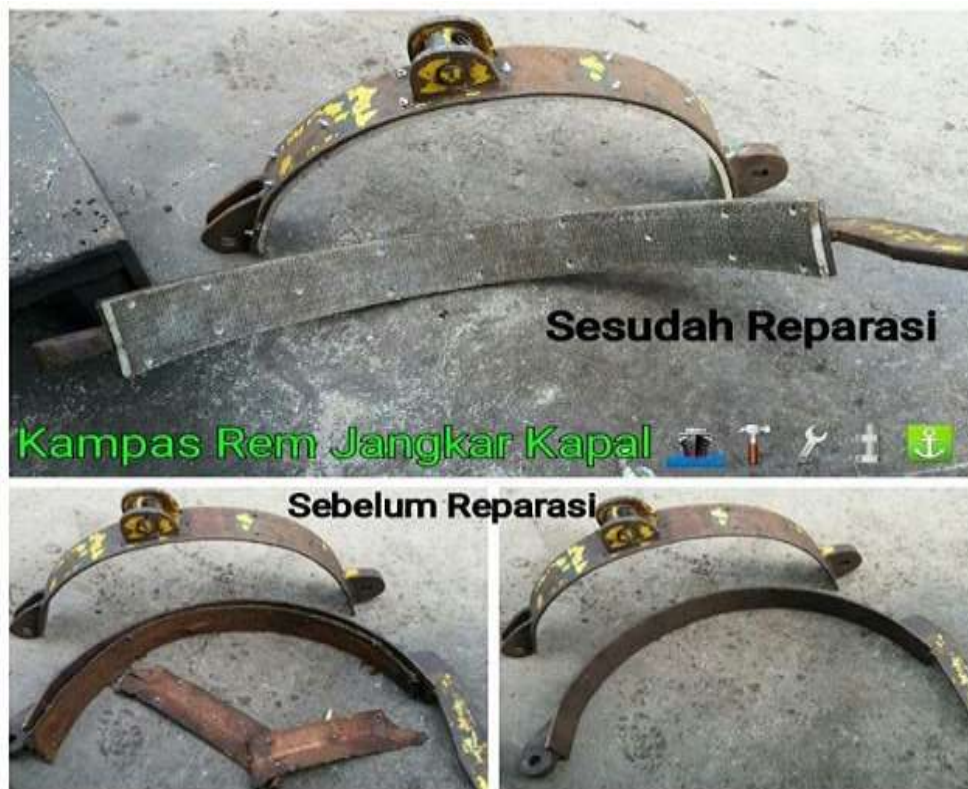
Gambar 11. Rem Mesin windlass di Kapal MV.JK GALAXY PT. AMAS SAMUDRA JAYA

Chain stopper pada umumnya dipasang antara mesin windlass dengan hawse pipe yang berguna menahan tarikan rantai dan jangkar saat kapal sedang berlabuh. Chain stopper harus memiliki kemampuan beban putus 80% dari beban putus rantai, dan dipasang secara baik dan posisi yang tepat diatas geladak forecastle deck , dan geladak didaerah ini juga harus diperkuat. Dengan memiliki kegunaan yang sama ada kalanya beberapa mata rantai diikatkan pada rantai jangkar didaerah hawse pipe untuk menahan beban rantai dan jangkar, namun demikian alat ini tidak dapat dianggap sebagai chain stopper . masilh4m. Wordpress. Com / 2010 / 04 / 08 / jangkar / teori mesin jangkar