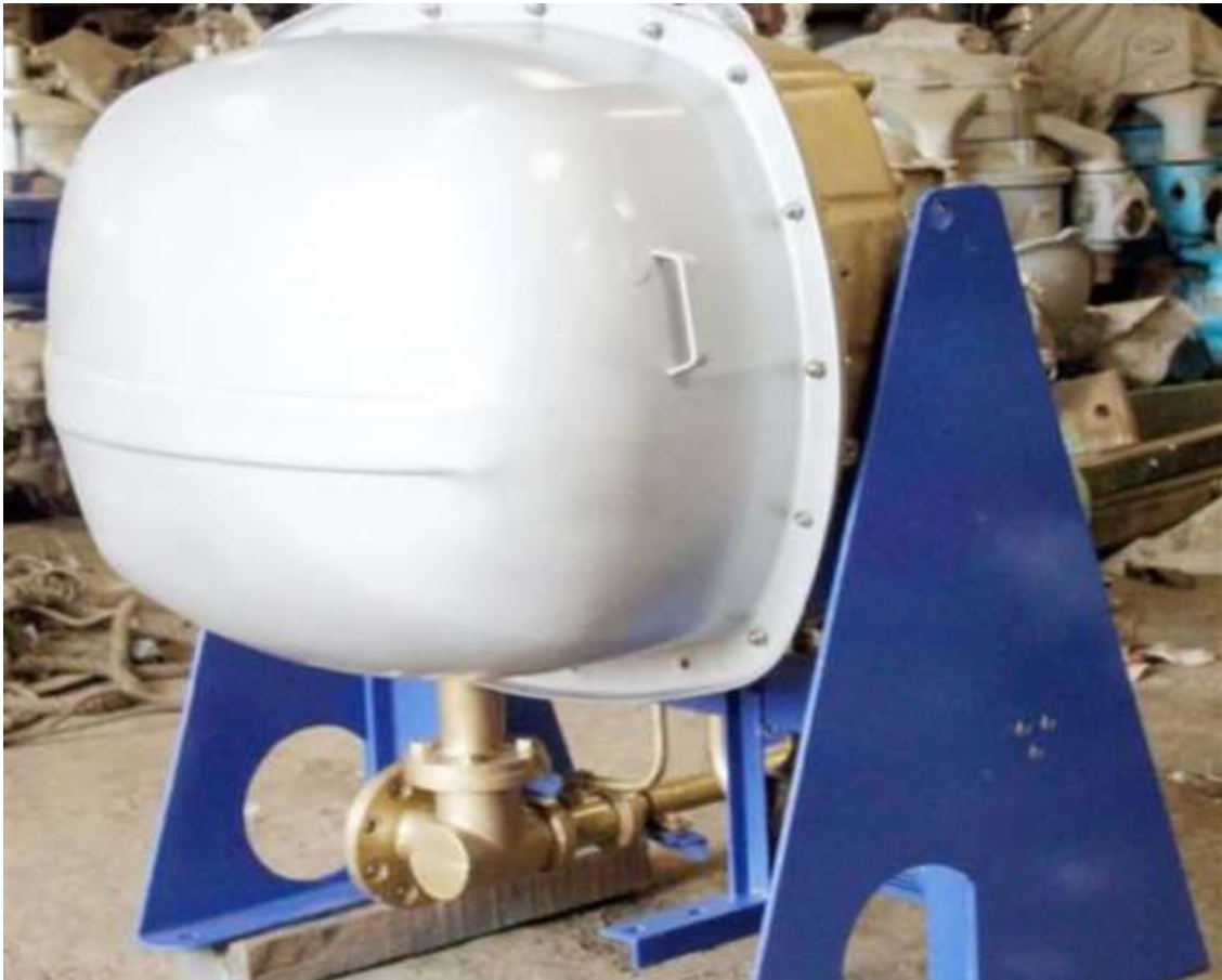
Gambar 2.5 Fresh Water Generator