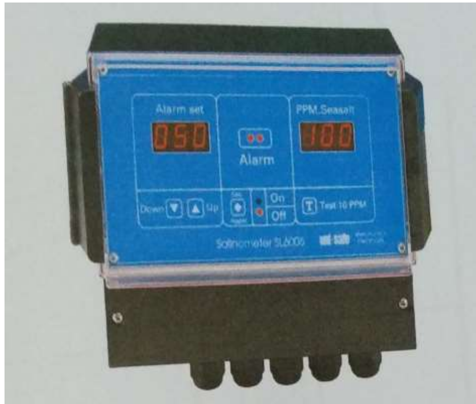
Gambar 2.4 Salinity indocator

Alat ini berfungsi untuk mendeteksi kadar garam yang dikandung oleh air tawar yang dihasilkan dari Fresh Water Generator melalui salinity cell . Jika kadar garamnya melebihi dari settingnya, misal 10 ppm ( part per million ) maka alat ini akan memberikan tanda alarm.