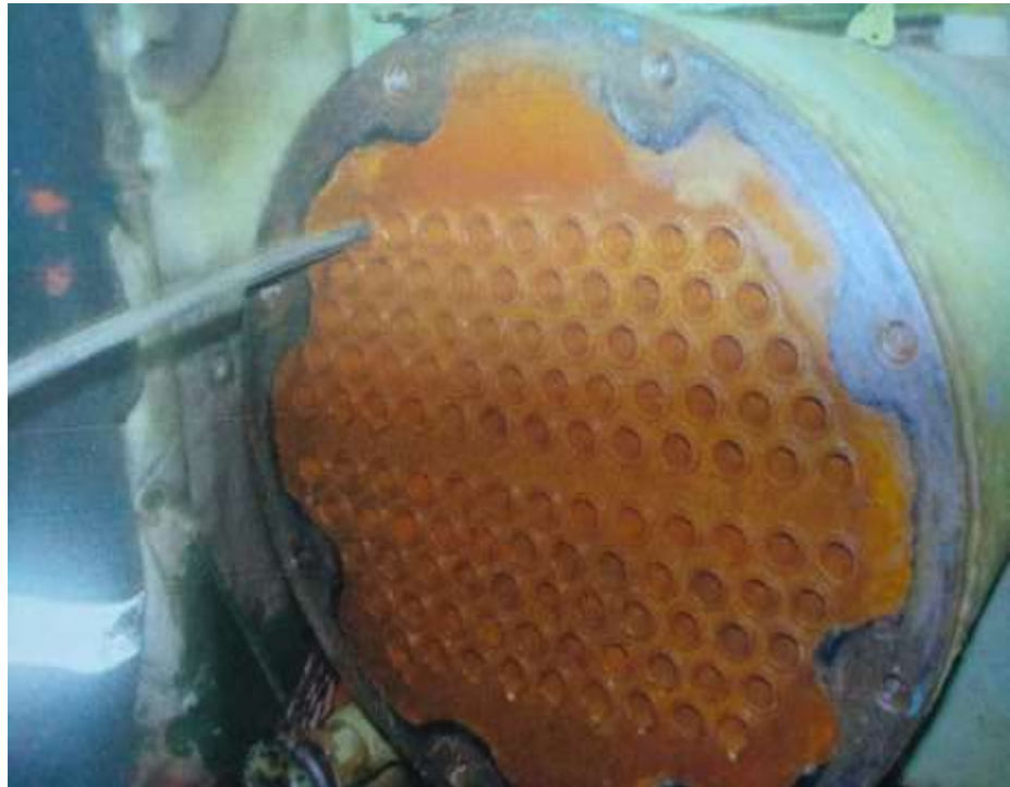
Gambar 2.1 Condenser

Sama seperti evaporator , kondensor juga terdiri dari pipa – pipa heat exchanger atau pipa – pipa pemindah panas yang terletak pada bejana pemisah yang tertutup, juga separator sheel yang berfungsi untuk mengubah bentuk gas/uap menjadi bentuk cair dengan proses kondensasi. Dalam kondensor diperlukan media pendingin yaitu air laut.