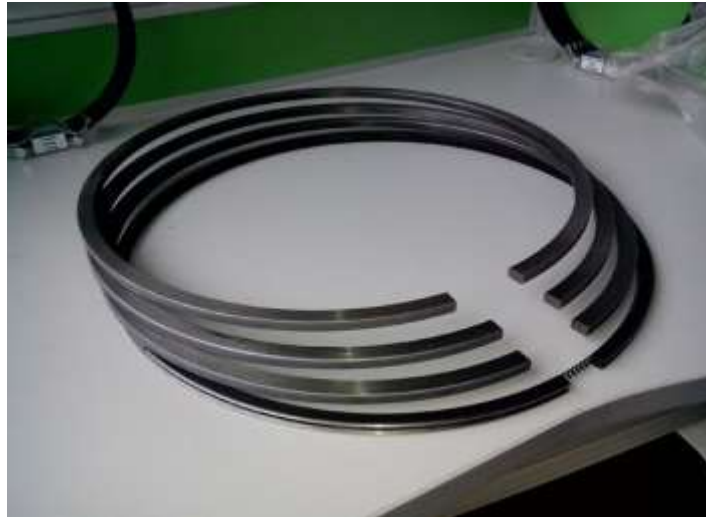
Gambar 10 Ring Piston KM.Cakra Kembar Satu