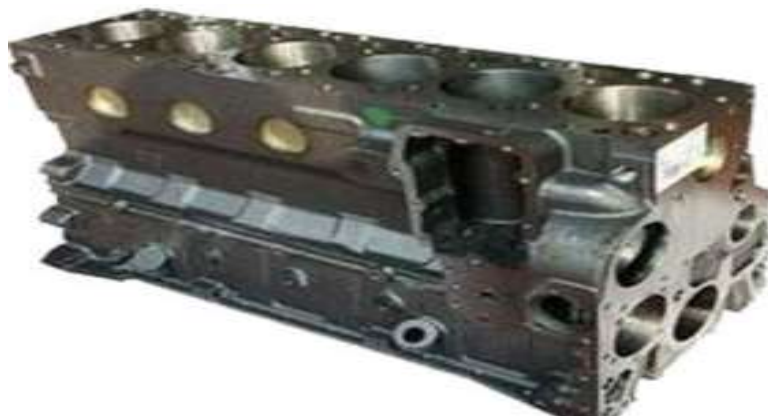
Gambar 9 Block Mesin

Engine block , terbuat dari logam campuran yang tahan panas, dan sebagai dinding dari sebuah cylinder.