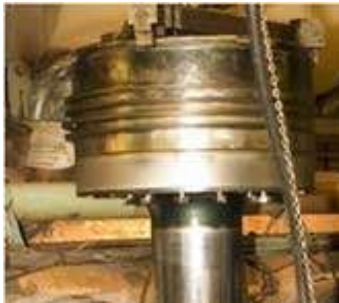
Gambar 2 Piston KM. Cakra Kembar Satu

Ujung lain dari ruang kerja silinder ditutup oleh torak yang meneruskan kepada poros daya yang ditimbulkan oleh pembakaran