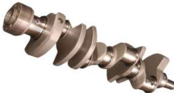
Gambar 4 Crankshaft

( https://willycar.com/2014/04/03/crankshaft-poros-engkol )