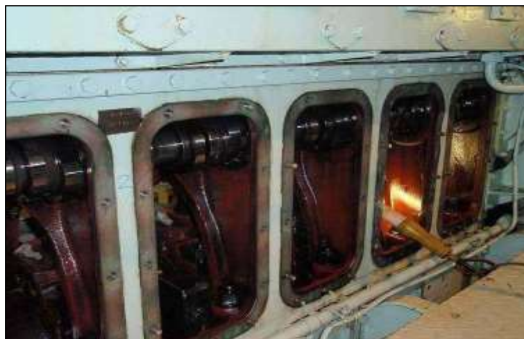
Gambar 6 Camshaft KM. Cakra Kembar Satu