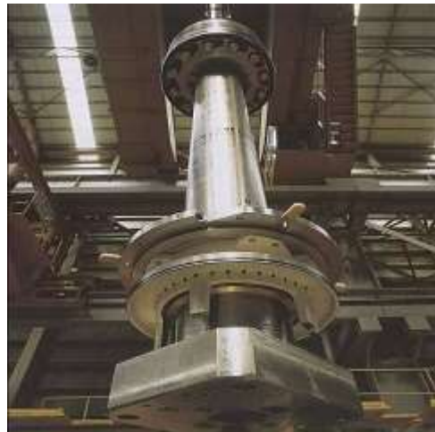
Gambar 3 Connecting Rod KM. Cakra Kembar Satu

Satu ujung, yang disebut ujung kecil dari batang engkol, dipasang pada pena pergelangan atau pena torak yang terletak di dalam torak. Ujung besar mempunyai bantalan untuk pen engkol. Batang engkol mengubah dan meneruskan gerak bolak balik ( reciprocating ) dari torak menjadi putaran continue pena engkol selama langkah kerja dan sebaliknya selama langkah yang lain.