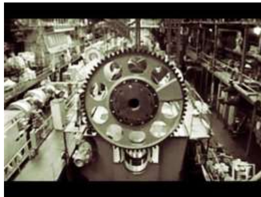
Gambar 5 Flywheel KM.Cakra Kembar Satu

Dengan berat yang cukup dikuncikan kepada poros engkol dan menyimpan energi kinetik selama langkah daya dan mengembalikanya selama langkah yang lain. Roda gila membantu menstart mesin dan juga bertugas membuat putaran poros engkol seragam.