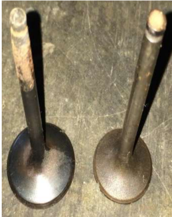
Gambar 8 Valve/klep mesin induk KM. Cakra Kembar Satu