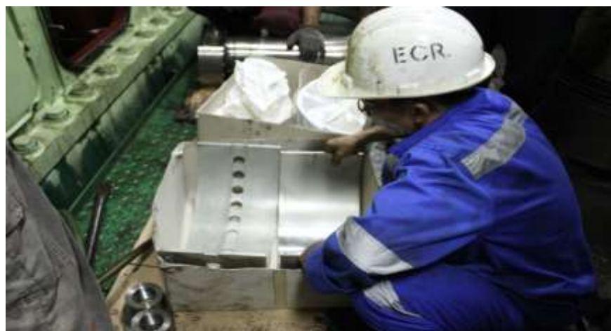
Gambar 11 Bearing/Metal KM. Cakra Kembar Satu

Fungsi : Mencegah keausan dan mengurangi gesekan pada poros engkol (crank shaft)