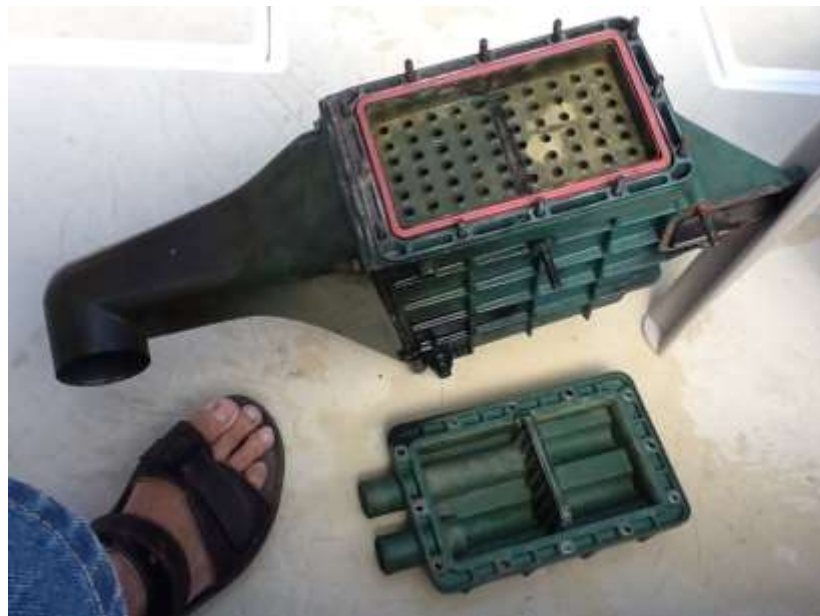
Gambar 5. Intercooler

Intercooler pada mesin diesel adalah suatu alat pendingin udara yang berguna untuk mendinginkan udara yang berasal dari perangkat Turbo Charger di dalam mesin diesel tersebut. Udara yang disuplai Turbo Charger ke mesin merupakan udara yang berasal dari gas buang dan memiliki suhu yang sangat panas. Oleh karena itu, fungsi Intercooler pada mesin diesel merupakan salah satu hal yang cukup penting. Selain mendinginkan udara, Intercooler juga berfungsi untuk memadatkan udara pada mesin sehingga mesin memiliki tenaga yang lebih besar. MV.JULIANTO MOELIODIHARDJO (2018).