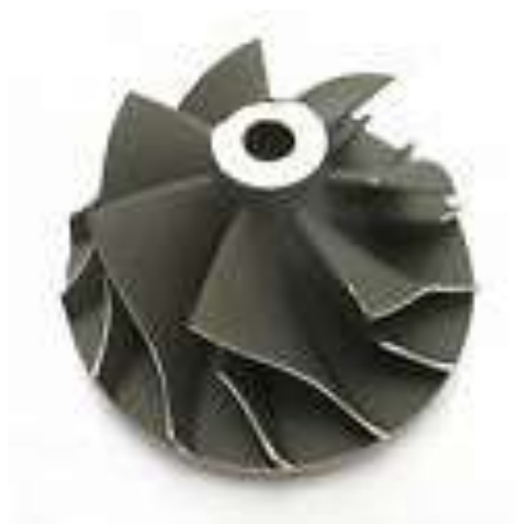
Gambar 1. Turbin

Turbin adalah suatu komponen mekanik yang berfungsi untuk mengkonversikan energi panas fluida yang melewatinya menjadi energi mekanis putaran poros Turbin. Setiap Turbin selalu melibatkan fluida yang mengandung energi panas yang mengalir melewati sudu-sudu Turbin. Setiap sudu Turbin berdesain membentuk nozzle-nozzle sehingga disaat fluida melewatinya, fluida akan terekspansi diikuti dengan perubahan energi panas menjadi mekanis. MV.JULIANTO MOELIODIHARDJO (2018).