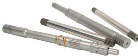
Gambar 4. Shaft Turbo Charger