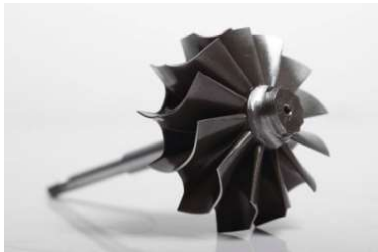
Gambar 2. Kompresor

Kompresor Turbo Charger tipe sentrifugal dan tersusun atas dua bagian utama yakni sudu-sudu rotor dan casing . Pada saat impeller rotor kompresor mulai berputar dengan kecepatan tinggi, udara akan mulai terhisap dan masuk ke silinder. Kecepatan aliran udara akan turun dan tekanan statiknya akan meningkat ini akan diikuti dengan kenaikan temperatur juga. Selanjutnya, udara ini dialirkan untuk menuju ke Intercooler MV.JULIANTO MOELIODIHARDJO (2018).