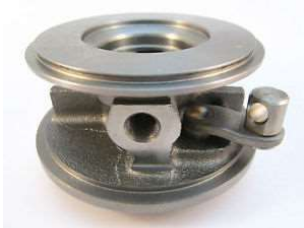
Gambar 3. Bearing Turbo Charger