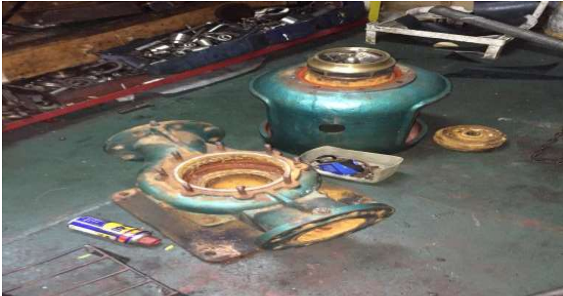
Gambar 2.2 bagian bagian pompa sentrifugal

Pompa sentrifugal dibagi beberapa bagian besar gambar pada lampiran yaitu: