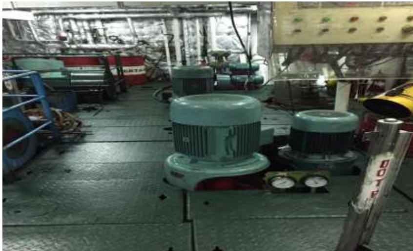
Gambar 2.1 Pompa Sentrifugal

Instalasi pompa yang memerlukan tempat penyimpanan air adalah kalau air dari hasil pemompaan itu tidak langsung dipergunakan atau air itu dipergunakan untuk bermacam-macam kebutuhan. Mengenai penempatan pompa tergantung pada macamnya pompa yang akan dipakai.