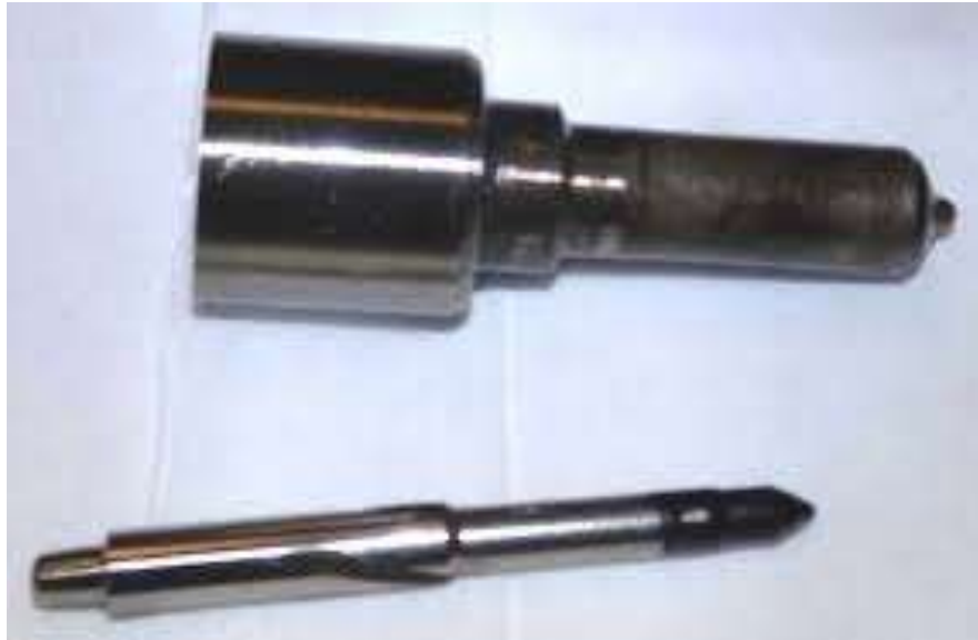
Gambar 2.2 Nozzel Neddle ( https://www.injectorrx.com )