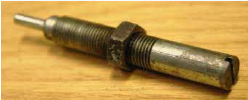
Gambar 2.6 Adjusting Screw ( Baut Penyetel )

Baut penyetel berfungsi untuk penyetelan kekuatan dan juga tekanan dari penyemprotan injector baut penyetel berada diatas dari mur pengaman yang berguna untuk melindungi bagian-bagian injektor lain dan digunakan untuk mengatur posisi mur pengaman dalam injector .