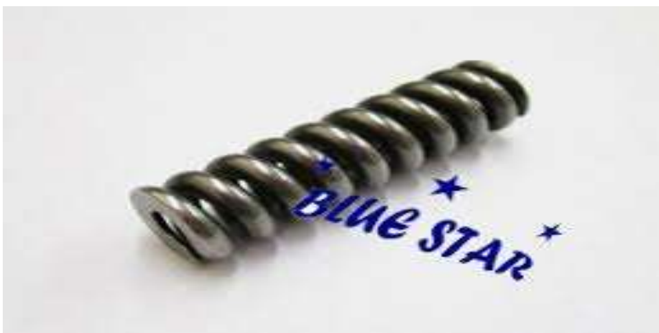
Gambar 2.7 Spring ( Pegas ) ( https://www.injectorrx.com )

Pegas disini berguna pengontrol elastisitas dari injector pada saat menginjeksikan bahan bakar agar alat penekan jarum dapat kembali keposisinya lagi dan digunakan dalam penyetelan kekuatan injeksi bahan bakar.