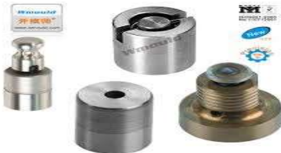
Gambar 2.9 Air Vent Valve ( Katup Pembuangan Angin ) ( https://www.injectorrx.com )

Katup pembuangan angin berfungsi untuk menghilangkan sisa-sisa angin dalam sistem pada saat pemasangan injector .