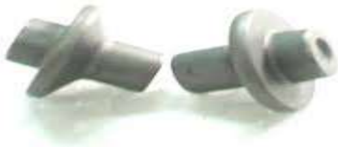
Gambar 2.4 Spindel ( Alat Penekan Jarum )

Alat penekan jarum yang digunakan untuk menekan jarum pada lubang injector pada saat proses pengabutan. Alat penekan jarum ini sangat penting dalam proses injeksi karena tinggi rendahnya tekanan dalam injektor ditentukan disini