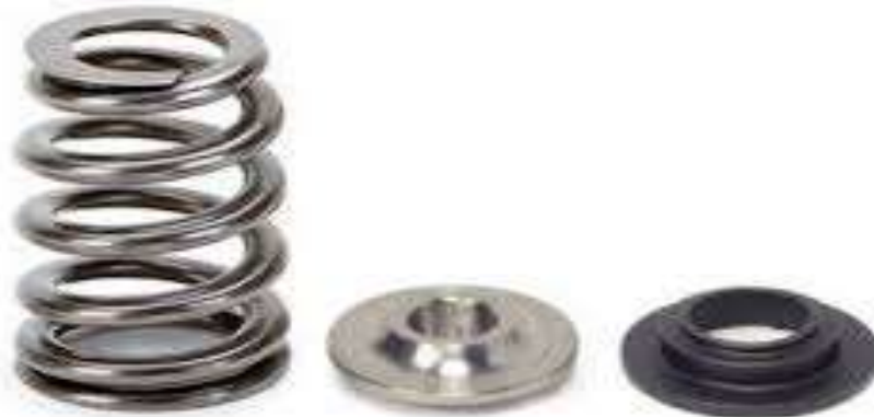
Gambar 2.8 Spring Retainer ( Penahan Pegas ) ( https://www.injectorrx.com )

Spring retainer sebagai penghubung antara pegas dan spindle berfungsi untuk menahan agar spindle tetap pada posisinya.