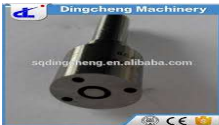
Gambar 2.3 Nozzel ( Mulut Pengabut ) ( https://www.injectorrx.com )

Mulut pengabut berfungsi untuk mengabutkan bahan bakar kedalam ruang bakar. Pada akhir penyemprotan tekanan didesak menurun dan jarum ditekan kembali pada bidang penutup. Pembukaan dan penutupan jarum pengabut dapat diawasi dengan sebuah jarum periksa. Pada cara pengabutan ini pompa bahan bakar mendesak, jika penyemprotan harus dimulai dan pompa berhenti jika penyemprotan harus berakhir.