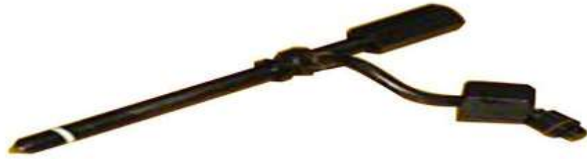
Gambar 2.11 Pencil Type Nozzle ( https://www.walmart.com/ip , 03-09-2018)