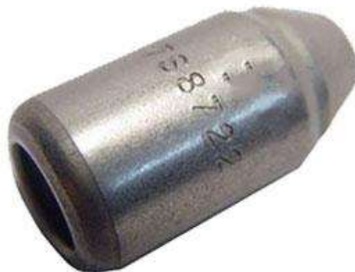
Gambar 2.10 Capsul Nozzle Type